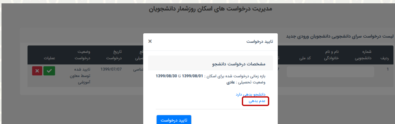
شکل ۳-۱۱: تایید درخواست خوابگاه توسط کارشناس اداره امور رفاهی دانشجویان