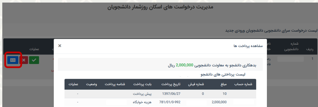
شکل ۳-۱۰: مشاهده جزئیات پرداخت بدهی دانشجو

چنانچه دانشجو بدهی نداشته باشد، گزینه عدم بدهی و سپس گزینه «تایید درخواست» انتخاب می شود (شکل