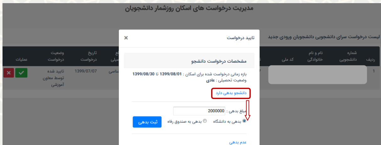
شکل ۳-۹: ثبت بدهی دانشجوی متقاضی اسکان

در صفحه انتخاب شده، کارشناس اداره امور رفاهی فهرست درخواست‌های دانشجویان را مشاهده می‌نماید. جهت تایید درخواست گزینه و جهت عدم تایید می‌تواند گزینه را کلیک نماید. در صورت کلیک بر روی ، صفحه تایید درخواست باز می‌گردد. در این صفحه وضعیت بدهی دانشجو در دو حالت «بدهی دارد» و «عدم بدهی» قابل انتخاب است. چنانچه دانشجو بدهی داشته باشد، باید مبلغ و محل بدهی مشخص شود. محل بدهی، «بدهی به دانشگاه» یا «بدهی به صندوق رفاه» است. سپس گزینه «ثبت بدهی» را کلیک می‌نماید (شکل ۳-۹).