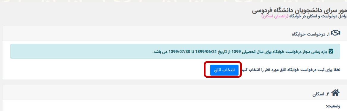
شکل ۳-۲: صفحه شروع درخواست اسکان

بعد از انتخاب گزینه امور خوابگاه، باید بر روی گزینه «انتخاب اتاق» کلیک نموده (شکل ۳-۲) و بازه زمانی درخواستی برای اسکان مشخص شود. حداکثر بازه زمانی مجاز برای اسکان در خوابگاه ۱ ماه است (شکل ۳-۳).