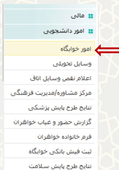
شکل ۱-۳: فرایند الکترونیکی اسکان پاره وقت (روزشمار) دانشجویان در منوی امور دانشجویی لبه آموزشی پورتال پویا

مقتضای اسکان برای ارسال درخواست می‌تواند در پورتال پویا از طریق لبه آموزشی و منوی امور دانشجویی، گزینه امور خوابگاه را انتخاب نماید (شکل ۱-۳).