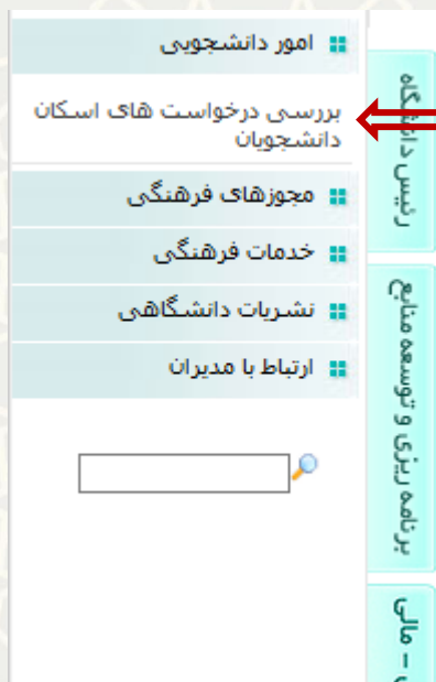
شکل ۳-۱۸: بررسی درخواست اسکان دانشجویان در منوی امور دانشجویی لبه آموزشی پورتال پویا

در صفحه انتخاب شده، برای تایید درخواست باید گزینه و برای عدم تایید، گزینه را کلیک نمایید (شکل